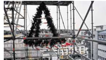
► Ein halbes Stockwerk hoch ist der Richtkranz, der seit gestern am achten Stock hoch über der City vor der Fassade des Hospitals hängt.