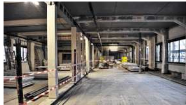
► 1600 Quadratmeter groß ist das achte Obergeschoss, in dem gestern Richtfest gefeiert wurde. Jetzt kann mit dem Innenausbau begonnen werden.