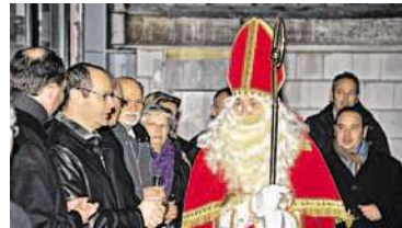
► Hoher Besuch: St. Nikolaus kann sich demnächst Treppen und Aufzug sparen – er will mit seinem Rentiergespann auf dem neuen Heliport landen.