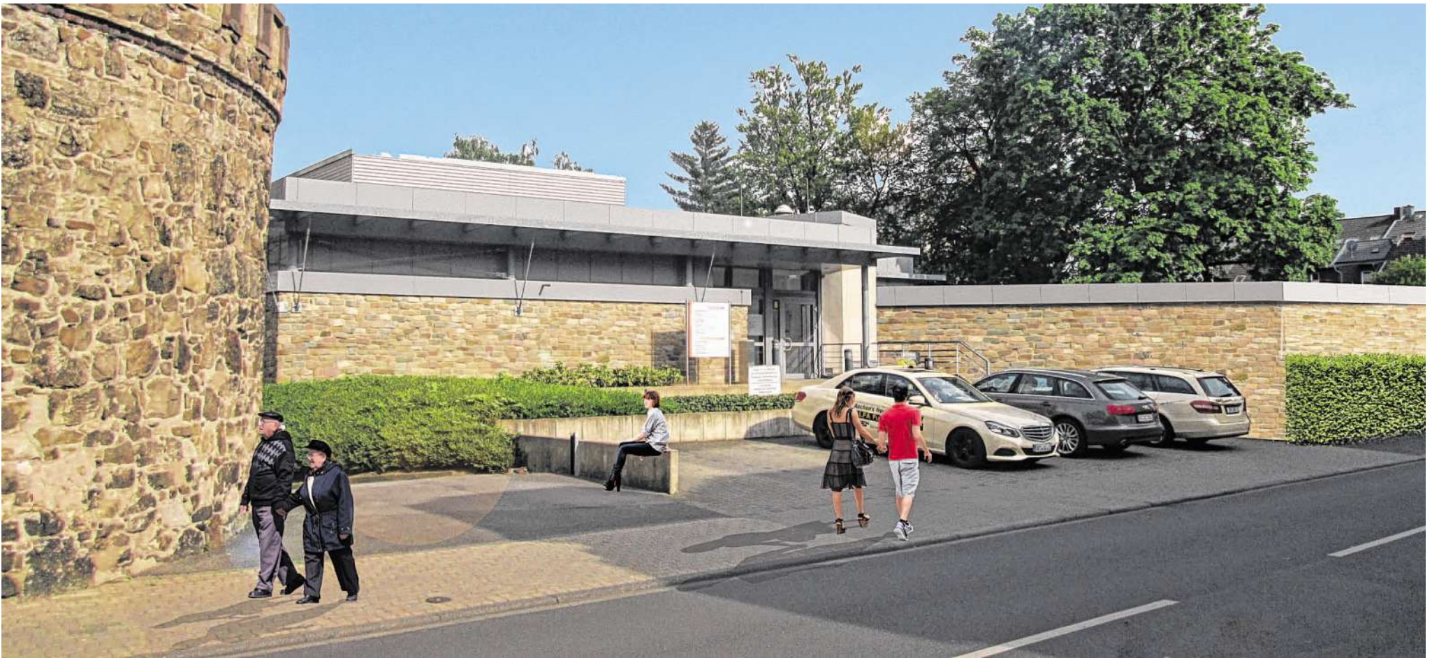
Der Rundturm der früheren Burg steht Pate für die Wandgestaltung des neuen „Strahlenbunkers“ (rechts) neben dem Haupteingang der Radiologischen Praxis, der im Straßenbild der Dechant-Deckers-Straße kaum auffallen dürfte.