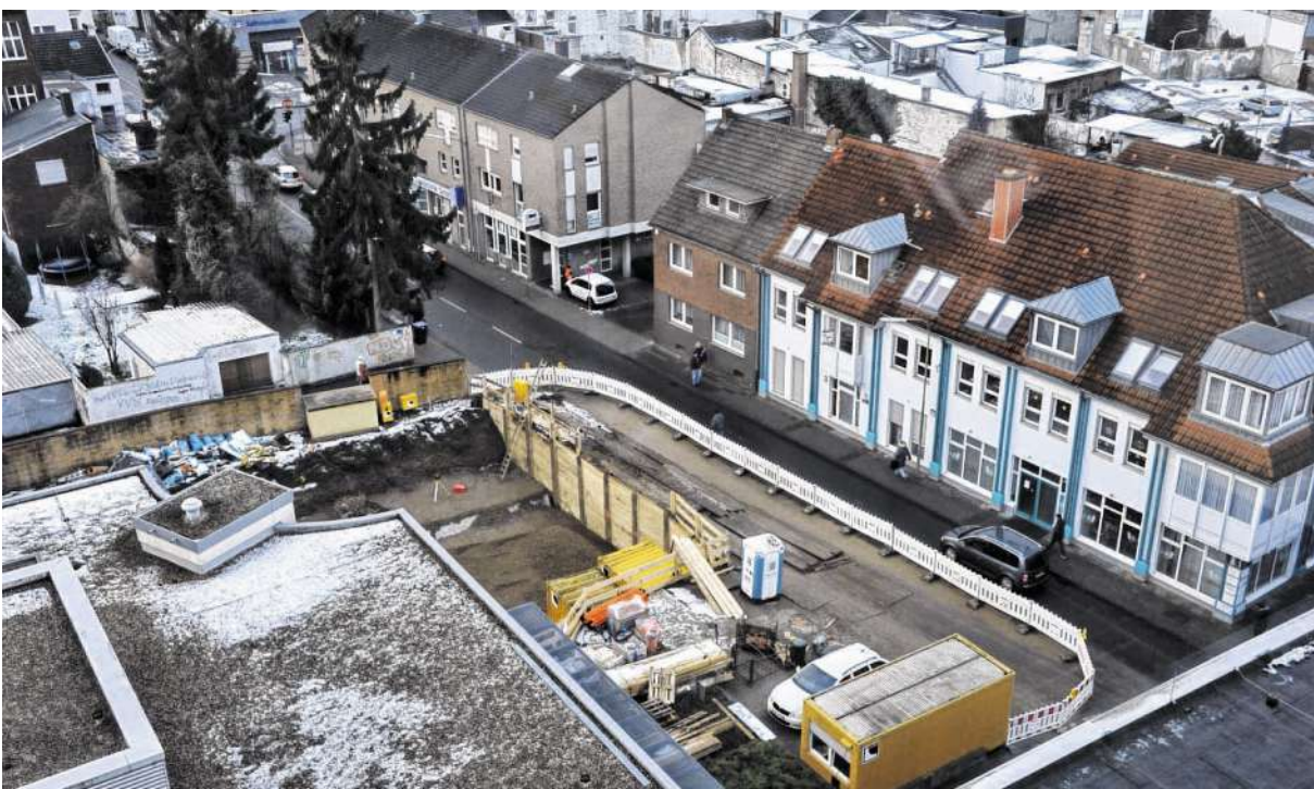
Baustelle an der Dechant-Deckers-Straße: Hier entsteht der neue „Strahlenbunker“. Der größte Teil des Gebäudes verschwindet unter der Erde.

Und auch, wenn „Strahlenbunker“ und Privatstationen fertig sind, feilt das Hospital weiter an seiner Qualität: „Dann steht die Modernisierung der kompletten Kurzeit ist an“, so Peter Hering. Zurzeit ist das Vorhaben in der Genehmigungsphase. Drei weitere topmoderne Herzkathetermessplätze sind bereits bestellt und werden Mitte des Jahres eingerichtet.